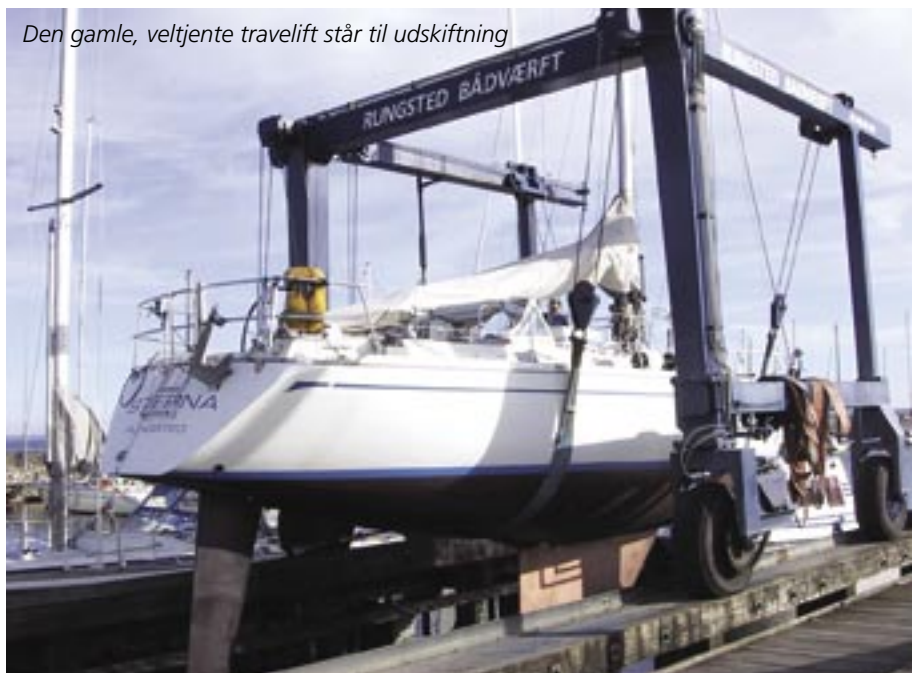
Den gamle, veltjente travelift står til udskiftning

Alt løsøre som: stiger, presenninger, stativer til presenninger, kontravægte, klodser, malerstativer o.l. kan ikke opbevares på havnen, hvorfor det vil blive fjernet, efter at den tilhørende båd er søsat.